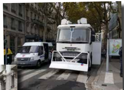
L'engin lanceur d'eau (ELE)