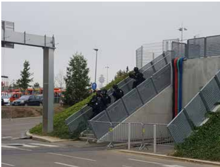
Exercices antiterroriste avec les effectifs de la CRS 47