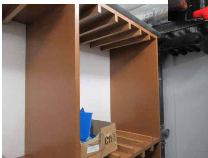
Range boucliers dans les armureries