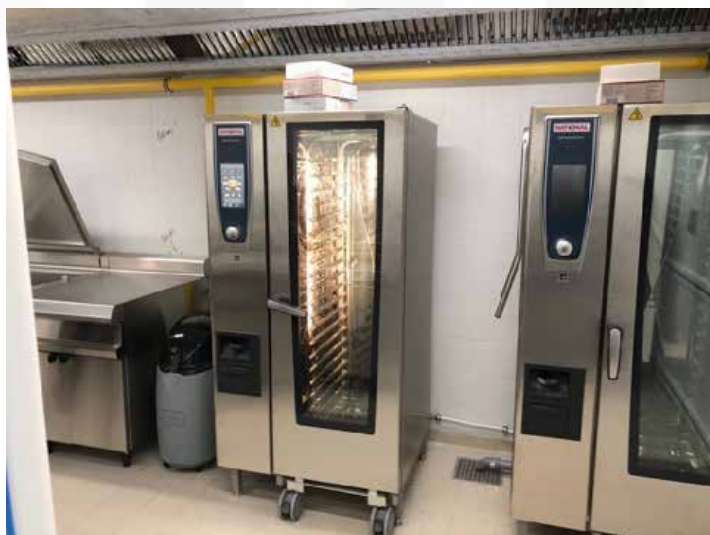
Armoires de cuisson multifonctions