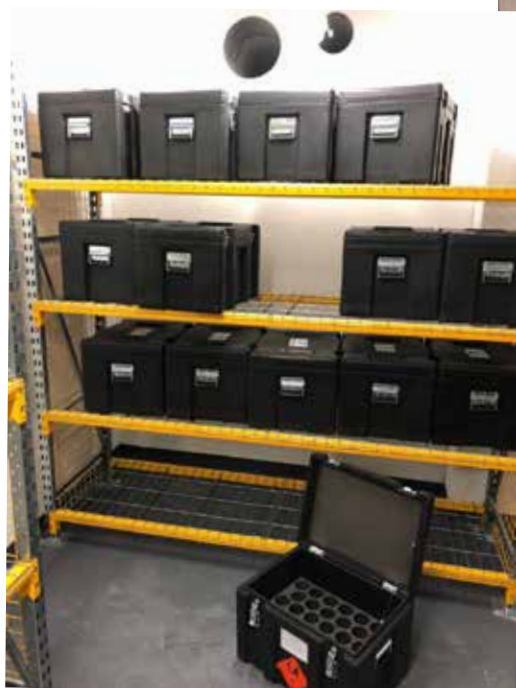
Malles de rangement pour munitions