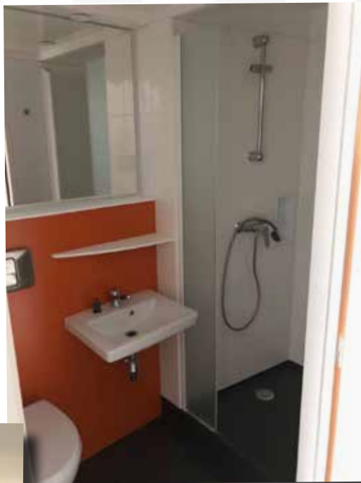
Salle de bain individuelle