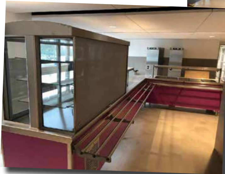
La partie self