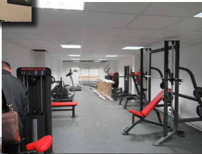
Salle de sport