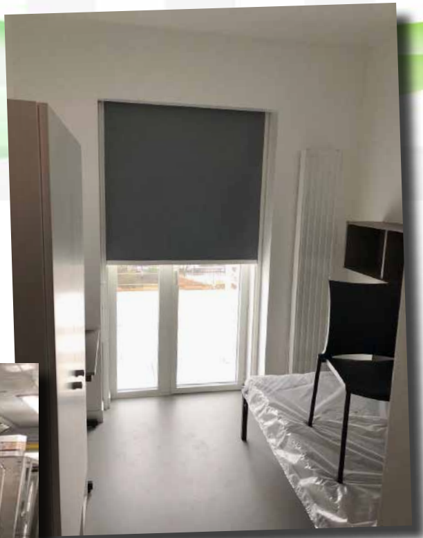
Batterie de cuisson