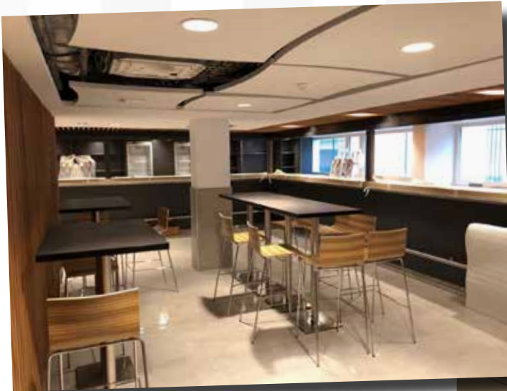
Second bar de surface plus restreinte