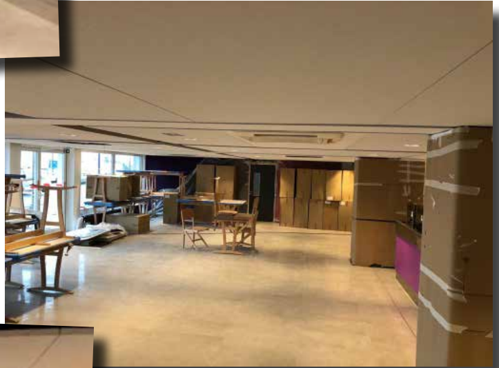
Vue d'ensemble de la salle de restauration