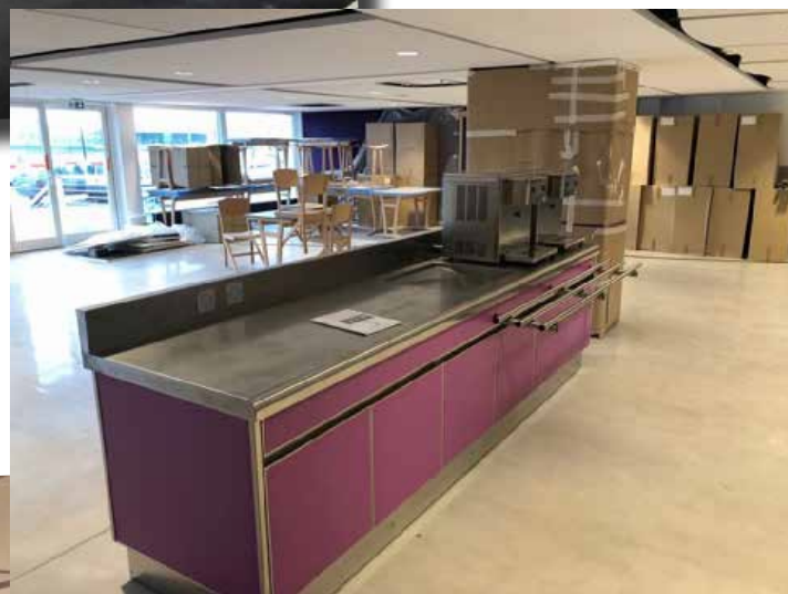
1 er bar