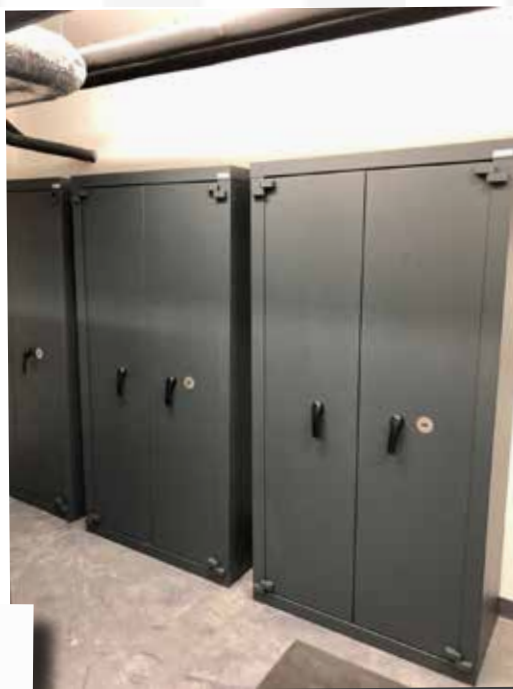
Armoires de stockage HKG36