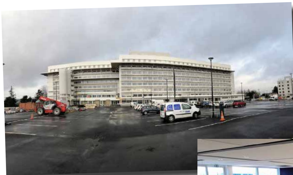
Vue extérieure du bâtiment