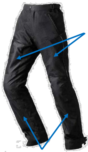
Aérations mesh partie haute (cuisses)

Ces deux effets sont pensés pour affronter les chaleurs estivales avec des larges empiècements en mesh (mailles aérées), sans pour autant faire l'impasse sur la sécurité puisqu'ils sont munis de coques et de protections homologuées CE au niveau des épaules, des coudes, des genoux et des hanches.